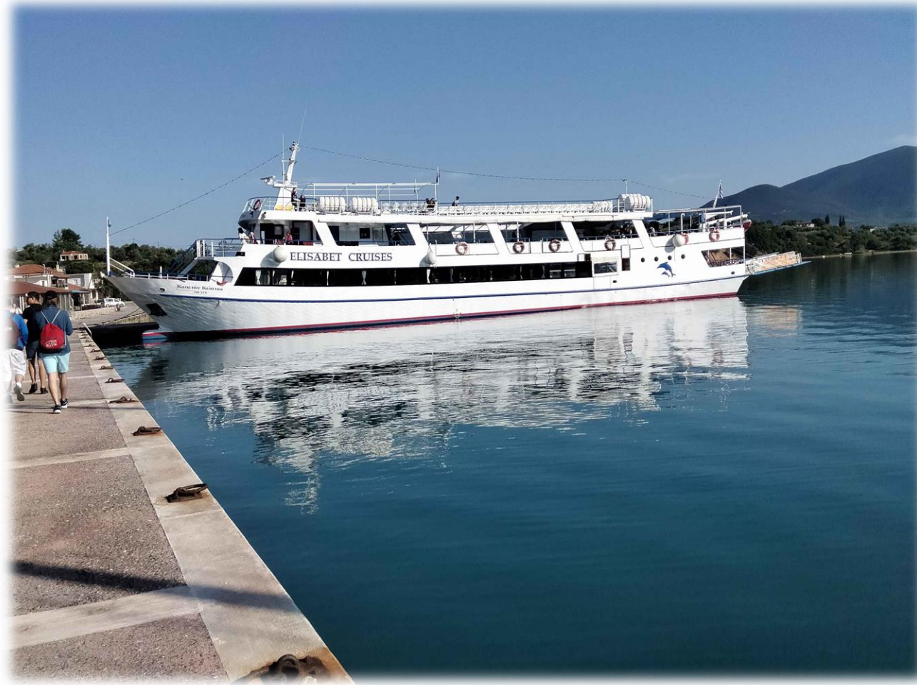
Statek którym podróżowaliśmy na wyspę